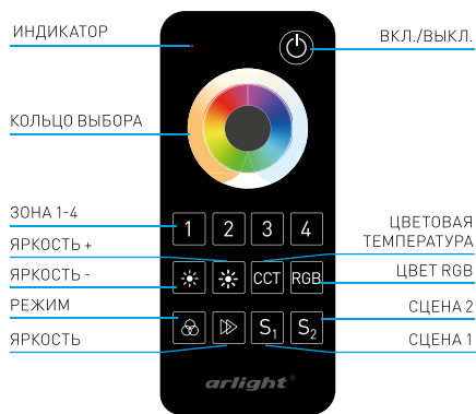
Рис. 1. Пульт ДУ.